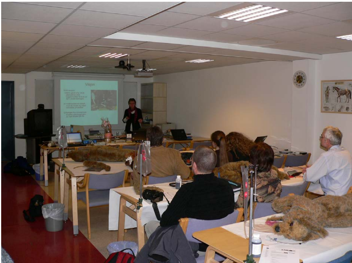
Fra åpningen av et av NVHs satsningsområder – Multimediarommet/treningsklinikken