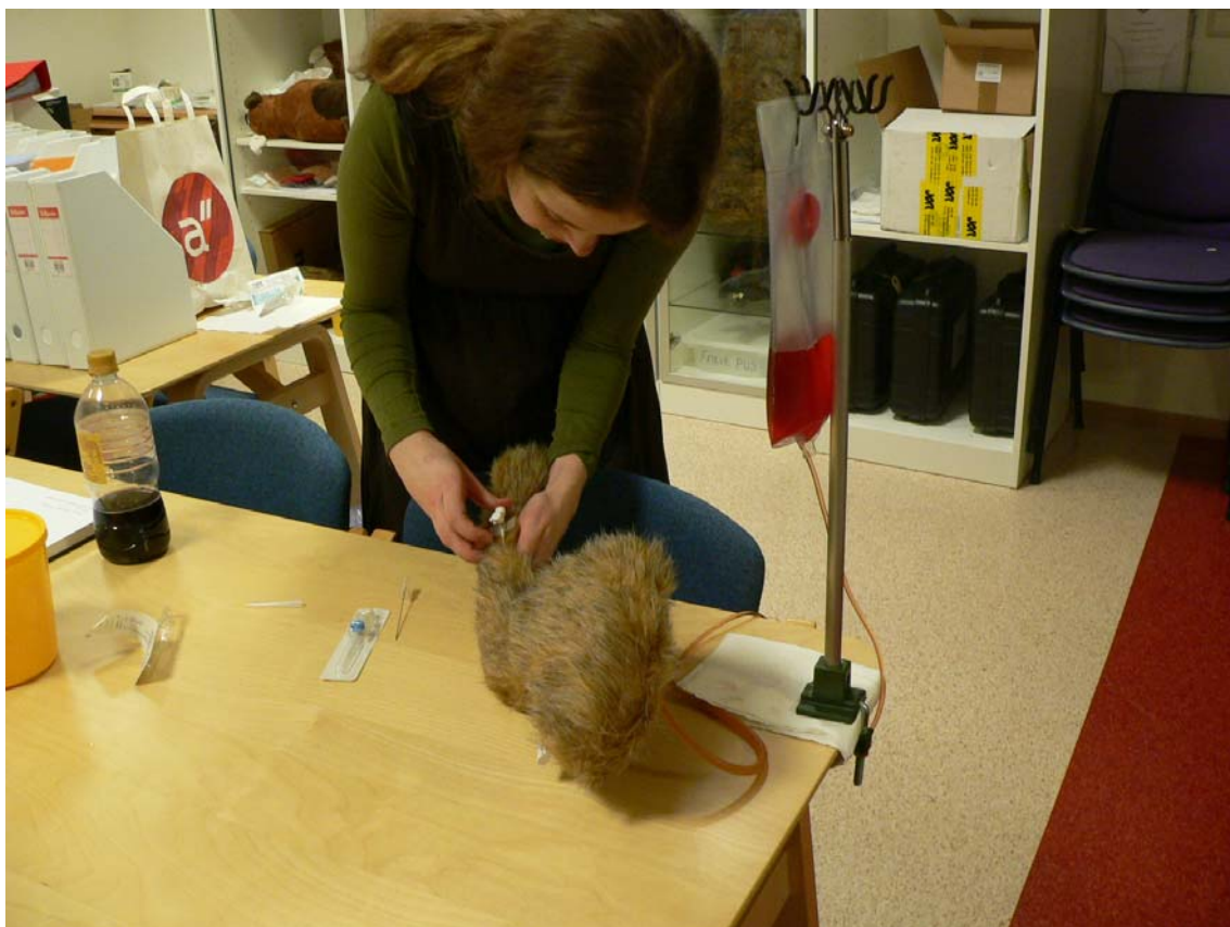
Student som trener på innlegg av venekateter i høgskolens multimediarom/ treningsklinikk